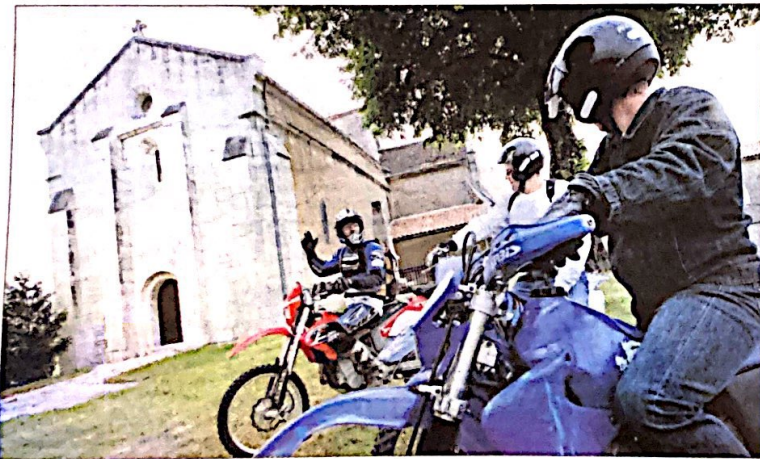
Balade touristique, le circuit ne s'en adresse pas moins aux accrocs de la moto. A travers chemins de terre et broussailles

A Rouillet la base Aquajelland (06 76 13 61 74) qui loue des jets sur un plan d'eau propose aussi des ballades en quad, à l'extérieur du site. A partir de 40 € la sortie. Sur réservation uniquement.